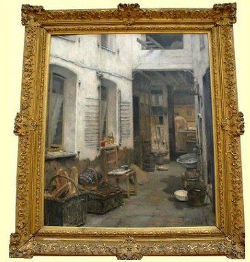
La boulangerie des frères Coquelin Son oeuvre de référence

Jean-Charles CAZIN (1841-1901) Peintre d'histoire et paysagiste, céramiste, frère du précédent. Doué pour les arts plastiques, le bachelier JC. CAZIN se forme sous la férule de son maître indéfectible Horace LECOQ de BOISBAUDRAN (1802-1897), à l'Ecole de dessin, rue de l'Ecole de médecine à Paris. Devenu professeur puis Conservateur de musée des Beaux-Arts de Tours, son caractère de nomade l'entraîne à visiter les musées de France et d'Europe. Il expose 180 toiles avec son fils Michel, aux Etats-Unis et en Ecosse (1893). Malade du cœur depuis son enfance, il meurt au Lavandou ou, contre sa volonté, il repose loin de son cher boulonnais. Certes, le cimetière a été réaménagé autour de sa tombe ornée de bas-reliefs par les soins de son épouse Marie.