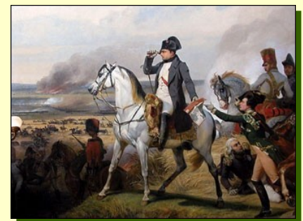
La bataille de Wagram, d'Horace VERNET