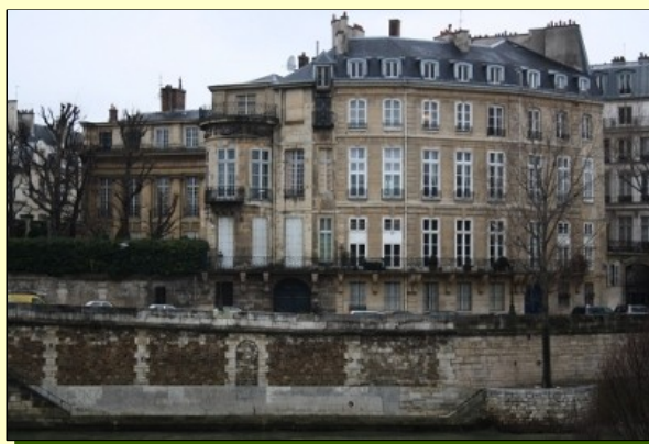
L'Hôtel LAMBERT, témoin du 17 ème siècle