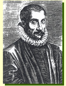
Jacques GUILLEMEAU 1549-1613