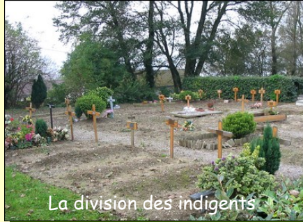
La division des indigents