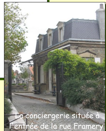
La conciergerie située à l'entrée de la rue Framery