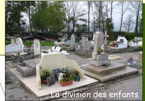
La division des enfants