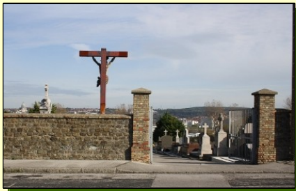
entrée rue Georges Clémenceau