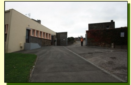
Conciergerie et entrée, rue A. HUGUET

Unique nécropole de Boulogne située sur le territoire de la commune de Le Portel, donc sur la rive gauche de la Liane, ce cimetière est ouvert depuis le 22 septembre 1854. Agrandi à différentes reprises (1884, 1893, 1897, 1905 et 1922), sa conciergerie est reconstruite en 1962. Pas de « sépulture médicale » repérée ... malgré l'extrême gentillesse des employés !