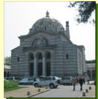
Le crématorium de style néo-byzantin des architectes FORMIGE (1885)