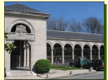
Le columbarium-déambuloire des architectes FORMIGE (1889)