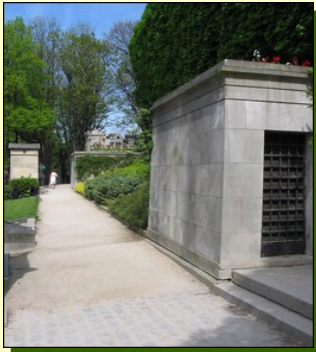
Une entrée de la crypte-ossuaire (1950)

Ancienne demeure bourgeoise (folie-REGNAULT, 1430) puis maison des Jésuites (1626), elle est habitée par le Père François d'Aix de La Chaise (1624-1709), confesseur de Louis XIV et par son frère le Comte de La Chaise. Transformée en cimetière par le Préfet FROCHOT, les plans sont confiés à l'architecte Alexandre BRONGNIART. Ce parc de 17 hectares, aménagé en « jardin à l'anglaise », possède alors une entrée rue du Repos, proche du bâtiment de Conservation. De l'actuel rond-point Casimir PERIER rayonnent les allées du cimetière, limité au Nord par l'allée des marronniers. L'architecte de la Ville de Paris, Etienne Hippolyte GODDE (1781-1869) dessine l'actuelle chapelle funéraire (1823) située à l'emplacement de l'ancienne maison des Jésuites, puis la Porte monumentale (1825) qui ouvre Boulevard Ménilmontant sur le plus grand et le plus visité des cimetières parisiens.