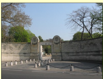
La porte monumentale de l'entrée principale, Bld Ménilmontant. Architecte GODDE (1820)