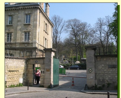
Proche du bâtiment de Conservation, l'entrée historique, dans l'actuelle rue du Repos