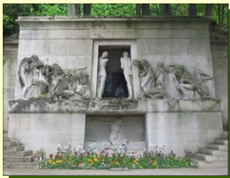
Le fameux monument aux morts d'Albert BARTHOLOME (1899)